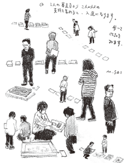
東京美術倶楽部にて二次審査風景(2025年2月21日)。スケッチ 齋正機